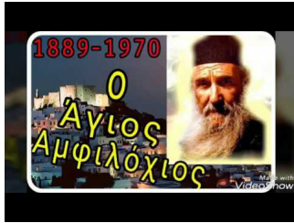
Ο Άγιος Αμφιλόχιος Μακρής της Πάτμου "ΑΦΙΕΡΩΜΑ"