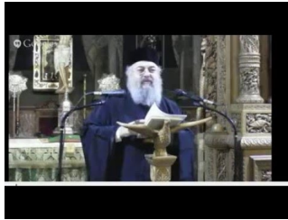
ομιλία περι του αγιου γεροντα Αμφιλοχιου Μακρη -1