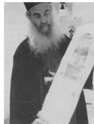
Όσιος Αμφιλόχιος Μακρής της Ιεράς Νήσου Πάτμου