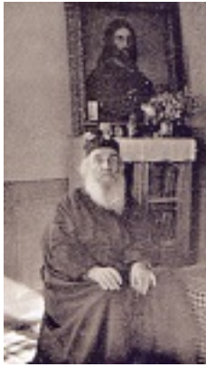
Όσιος Αμφιλόχιος Μακρής της Ιεράς Νήσου Πάτμου