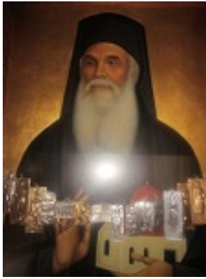
Όσιος Αμφιλόχιος Μακρής της Ιεράς Νήσου Πάτμου