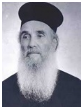
Όσιος Αμφιλόχιος Μακρής της Ιεράς Νήσου Πάτμου