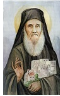
Όσιος Αμφιλόχιος Μακρής της Ιεράς Νήσου Πάτμου