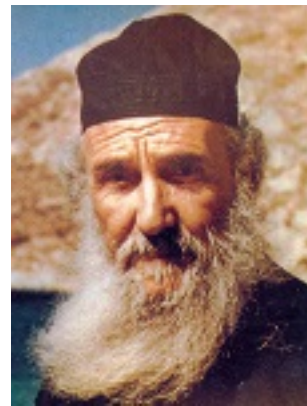
Όσιος Αμφιλόχιος Μακρής της Ιεράς Νήσου Πάτμου