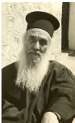
Όσιος Αμφιλόχιος Μακρής της Ιεράς Νήσου Πάτμου