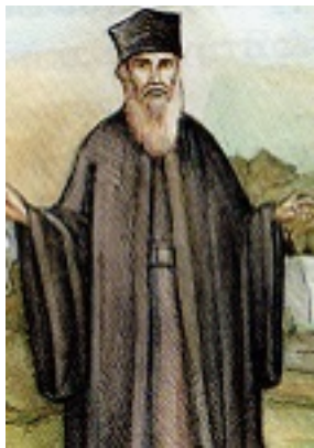
Όσιος Αμφιλόχιος Μακρής της Ιεράς Νήσου Πάτμου