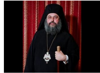
ομιλία περι του αγιου γεροντα Αμφιλοχιου Μακρη -2