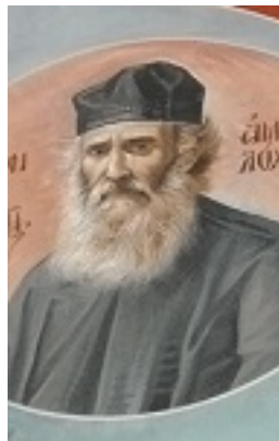
Όσιος Αμφιλόχιος Μακρής της Ιεράς Νήσου Πάτμου