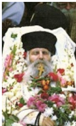
Όσιος Ιάκωβος (Τσαλίκης), ο Θεοφόρος, κατηγούμενος της Ιεράς Μονής Οσίου Δαυΐδ του εν Ευβοία