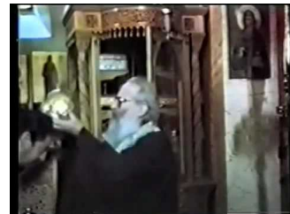
ΑΓΙΟΣ ΙΑΚΩΒΟΣ ΤΣΑΛΙΚΗΣ Ο ΕΝ ΕΥΒΟΙΑ - ΜΑΡΤΥΡΙΕΣ ΘΑΥΜΑΤΩΝ