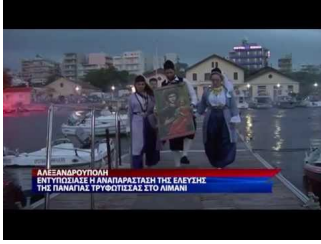
ΑΙΝΙΤΕΣ ΕΛΕΥΣΗ ΕΙΚΟΝΑΣ ΠΑΝΑΓΙΑ ΤΡΥΦΩΤΙΣΣΑ