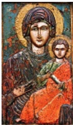
Σύναξη της Παναγίας Τρυφώτισσας στην Αλεξανδρούπολη