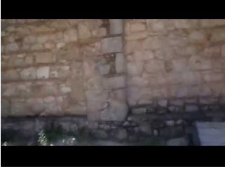
Παναγία Ζερβιώτισσα - Στύλος Αποκορώνου