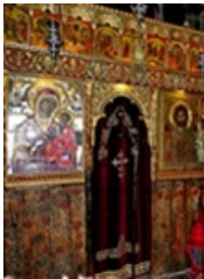
Σύναξη της Παναγίας Μολυβδοσκεπάστης στην Κόνιτσα