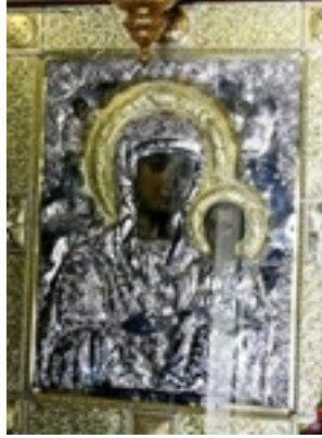
Σύναξη της Παναγίας Μολυβδοσκεπάστης στην Κόνιτσα