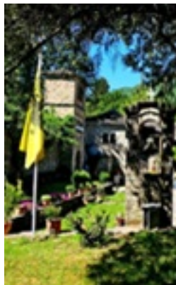
Σύναξη της Παναγίας Μολυβδοσκεπέαστης στην Κόνιτσα