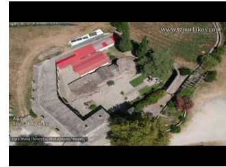
Ιερά Μονή Παναγίας Μολυβδοσκεπάστης στην Κόνιτσα Ιωαννίνων. Βίντεο Αφιέρωμα