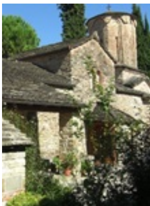
Σύναξη της Παναγίας Μολυβδοσκεπάστης στην Κόνιτσα