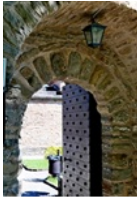
Σύναξη της Παναγίας Μολυβδοσκεπέαστης στην Κόνιτσα