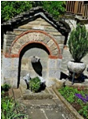
Σύναξη της Παναγίας Μολυβδοσκεπέαστης στην Κόνιτσα