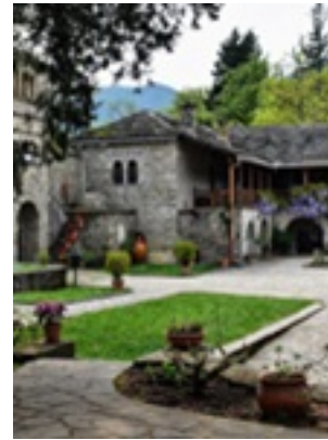
Σύναξη της Παναγίας Μολυβδοσκεπέαστης στην Κόνιτσα