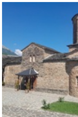
Σύναξη της Παναγίας Μολυβδοσκεπάστης στην Κόνιτσα