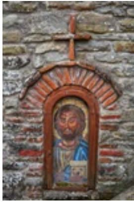
Σύναξη της Παναγίας Μολυβδοσκεπέαστης στην Κόνιτσα