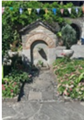
Σύναξη της Παναγίας Μολυβδοσκεπέαστης στην Κόνιτσα