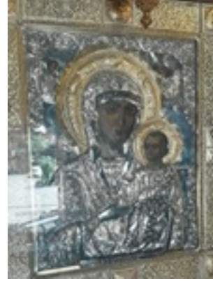
Σύναξη της Παναγίας Μολυβδοσκεπάστης στην Κόνιτσα