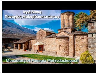
Παναγιά Μολυβδοσκεπάστη - Κόνιτσα