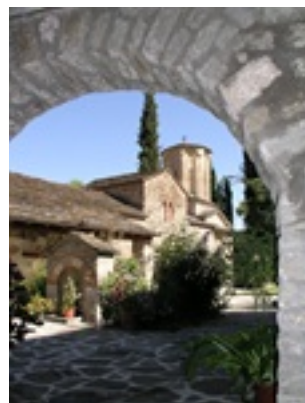
Σύναξη της Παναγίας Μολυβδοσκεπάστης στην Κόνιτσα