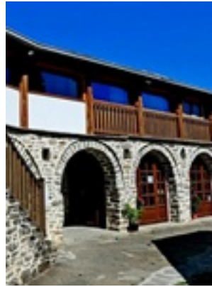
Σύναξη της Παναγίας Μολυβδοσκεπέαστης στην Κόνιτσα