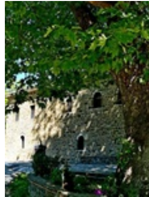
Σύναξη της Παναγίας Μολυβδοσκεπέαστης στην Κόνιτσα