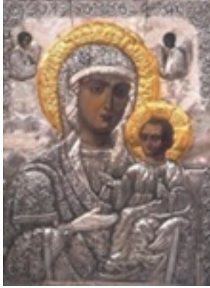
Σύναξη της Παναγίας Μολυβδοσκεπάστης στην Κόνιτσα