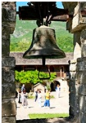
Σύναξη της Παναγίας Μολυβδοσκεπέαστης στην Κόνιτσα