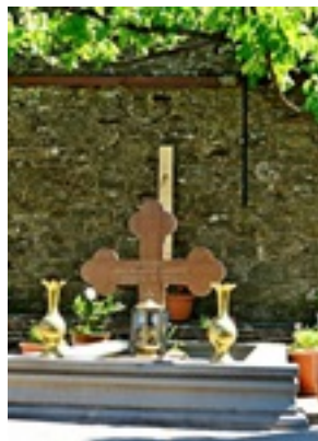
Σύναξη της Παναγίας Μολυβδοσκεπέαστης στην Κόνιτσα