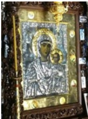
Σύναξη της Παναγίας Μολυβδοσκεπάστης στην Κόνιτσα