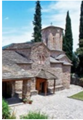
Σύναξη της Παναγίας Μολυβδοσκεπέαστης στην Κόνιτσα