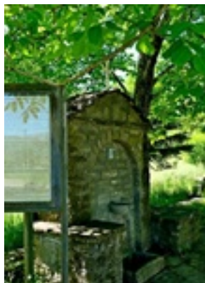
Σύναξη της Παναγίας Μολυβδοσκεπέαστης στην Κόνιτσα