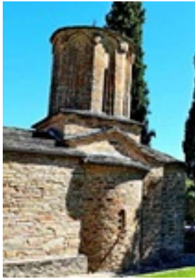
Σύναξη της Παναγίας Μολυβδοσκεπέαστης στην Κόνιτσα