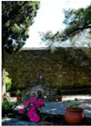
Σύναξη της Παναγίας Μολυβδοσκεπέαστης στην Κόνιτσα