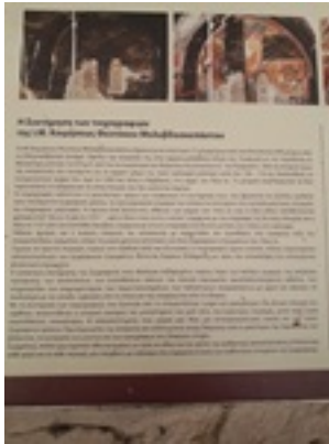
Σύναξη της Παναγίας Μολυβδοσκεπέαστης στην Κόνιτσα