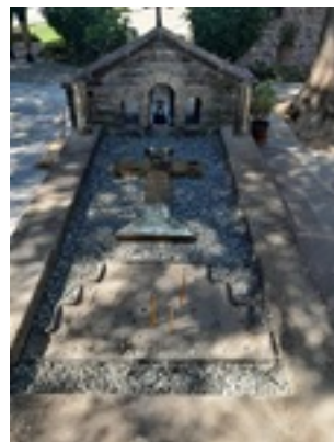
Σύναξη της Παναγίας Μολυβδοσκεπέαστης στην Κόνιτσα