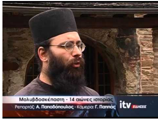
Μολυβδοσκεπάστη - 14 αιώνες ιστορίας - ITV ΕΙΔΗΣΕΙΣ - 29/4/2016