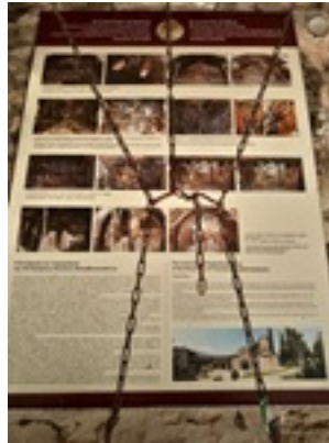
Σύναξη της Παναγίας Μολυβδοσκεπέαστης στην Κόνιτσα