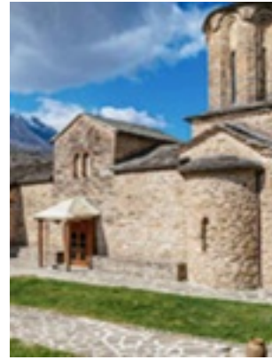
Σύναξη της Παναγίας Μολυβδοσκεπέαστης στην Κόνιτσα