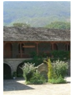
Σύναξη της Παναγίας Μολυβδοσκεπάστης στην Κόνιτσα