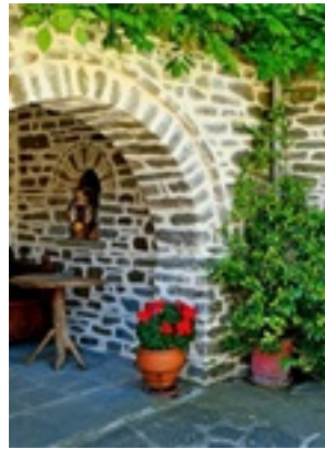
Σύναξη της Παναγίας Μολυβδοσκεπέαστης στην Κόνιτσα