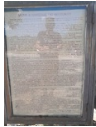
Σύναξη της Παναγίας Μολυβδοσκεπέαστης στην Κόνιτσα