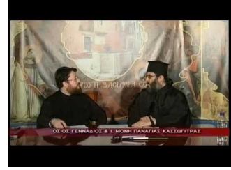
Ιερά Μονή Παναγίας Κασσωπίτρας (γ)