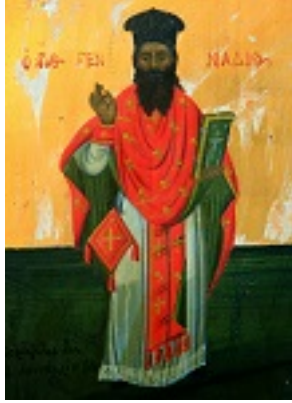
Όσιος Γεννάδιος Κερκύρας