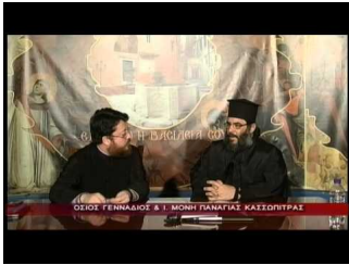
Ιερά Μονή Παναγίας Κασσωπίτρας (δ)