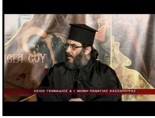
Ιερά Μονή Παναγίας Κασσωπίτρας (β)