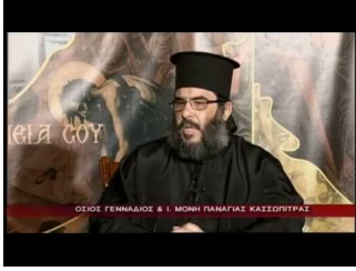
Ιερά Μονή Παναγίας Κασσωπίτρας (α)