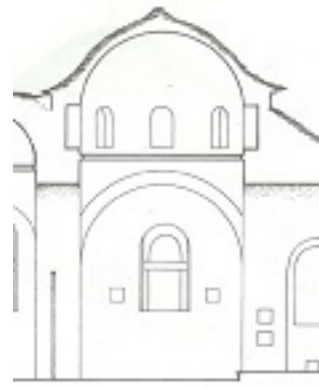
Τομή ναού Παναγιάς Βατούσαινας