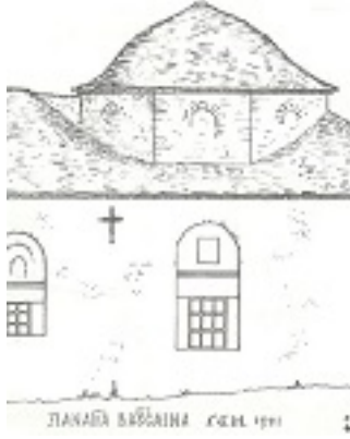
Σχέδιο ναού Παναγιάς Βατούσαινας