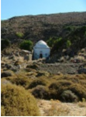
Παναγία Βατούσαινα στα Ψαρά