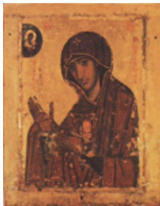
Παναγία η Μαχαριώτισσα