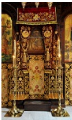
Παναγία η Μαχαριώτισσα