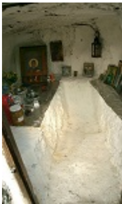
Το σπήλαιο του Οσίου Ιωάννη του Σηλεώτη