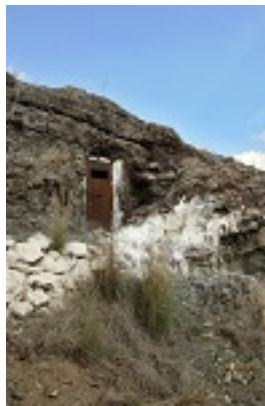
Το σπήλαιο του Οσίου Ιωάννη του Σηλεώτη