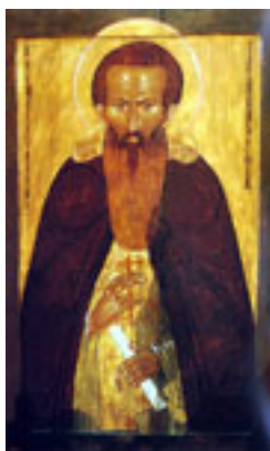
Όσιος Διονύσιος του Γλουσέτσκ ο Θαυματουργός