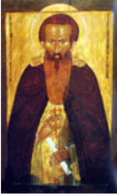
Όσιος Διονύσιος του Γλουσέτσκ ο Θαυματουργός