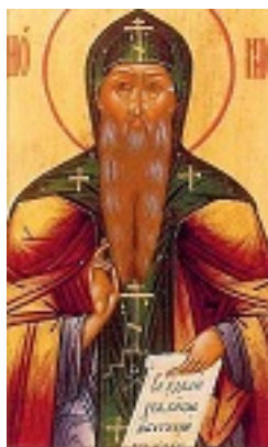
Όσιος Διονύσιος του Γλουσέτσκ ο Θαυματουργός