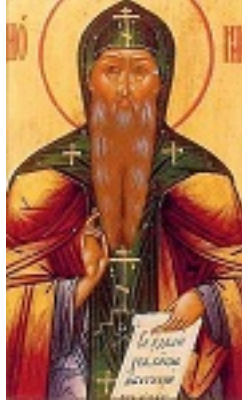
Όσιος Διονύσιος του Γλουσέτσκ ο Θαυματουργός