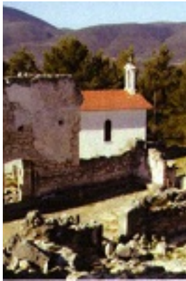
Μερική άποψη της Ιεράς Μονής Αγίων Φανέντων