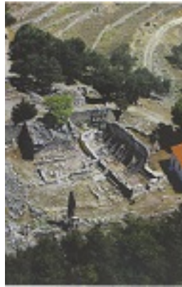
Πανοραμική άποψη της ερείπωμένης πλέον ιστορικής Ιεράς Μονής των Αγίων Φανέντων στην περιοχή της Σάμης Κεφαλληνίας