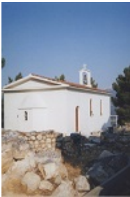
Το ανεγερθέν νεόδμητο παρεκκλήσιο δίπλα στα ερείπια της Ιεράς Μονής των Αγίων Φανέντων αποτελεί το επίκεντρο των λατρευτικών εκδηλώσεων προς τιμήν των Αγίων την Κυριακή των Αγίων Πάντων