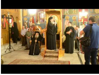
Αγίοι Φανέντες - Σάμη Κεφαλονιάς (A)