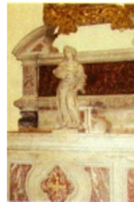
Η μαρμάρινη λειψανοθήκη με τα λείψανα των Αγίων Φανέντων στο ναό του Προφήτου Ζαχαρία στη Βενετία