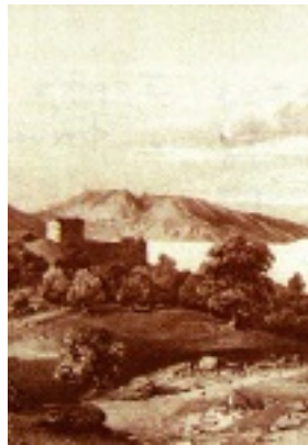
Άποψη της Ιεράς Μονής των Αγίων Φανέντων σε γκραβούρα του 1813 μ.Χ.