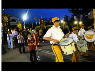
Αγίοι Φανέντες - Σάμη Κεφαλονιάς (B)