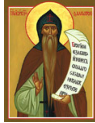
Όσιος Ισαάκιος ο Ομολογητής ηγούμενος Μονής Δαλμάτων