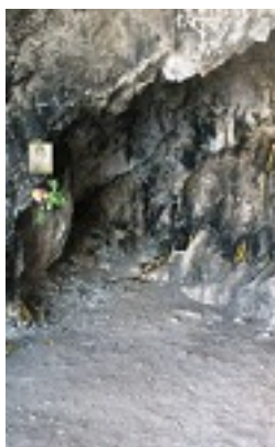
Ι. Μ. Παναγίας Κουτσουριώτισσας - Σπήλαιο ευρέσεως Εικόνας