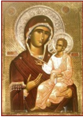
Παναγία η Κουτσουριώτισσα