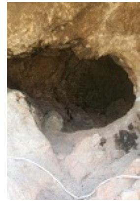
Ι. Μ. Παναγίας Κουτσουριώτισσας - Σπήλαιο ευρέσεως Εικόνας