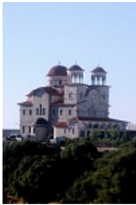
Ι. Μ. Παναγίας Κουτσουριώτισσας