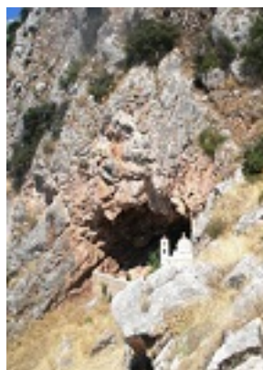
Ι. Μ. Παναγίας Κουτσουριώτισσας - Σπήλαιο ευρέσεως Εικόνας