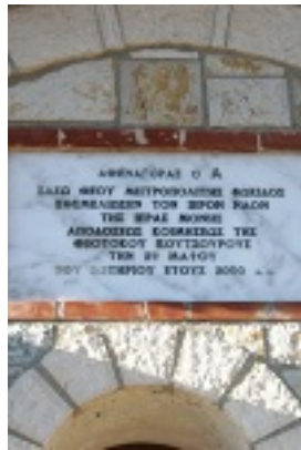
Ι. Μ. Παναγίας Κουτσουριώτισσας