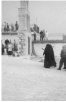
Το μοναστήρι της Παναγίας της Κουτσουριώτισσας, όπως ήταν παλιότερα. Δεξιά φαίνονται ολοκάθαρα τα περίφημα κελιά