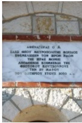
Ι. Μ. Παναγίας Κουτσουριώτισσας