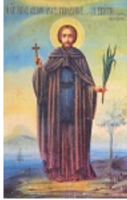
Άγιος Γεράσιμος ο νέος ο Καρπενησιώτης