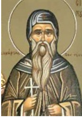
Άγιος Γεράσιμος ο νέος ο Καρπενησιώτης