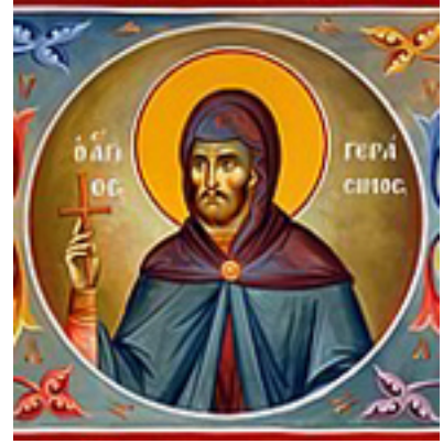
Άγιος Γεράσιμος ο νέος ο Καρπενησιώτης