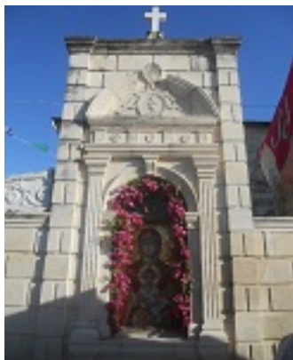
Παναγία Ελευθερώτρια στην Ζάκυνθο