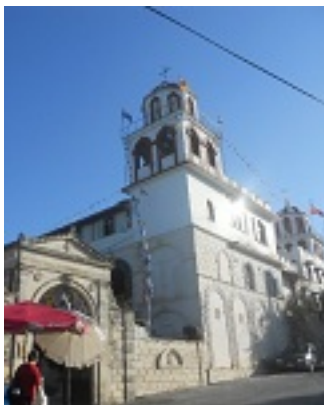
Παναγία Ελευθερώτρια στην Ζάκυνθο