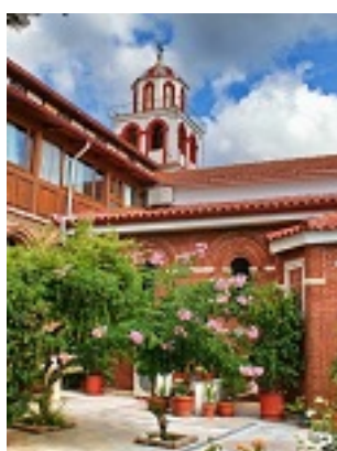
Παναγία Ελευθερώτρια στην Ζάκυνθο