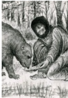
Η Οσία Σοφία η εν Κλεισούρα ταΐζει μια αρκούδα