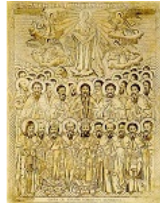
Οι άγιοι του Άθω - μέσα 19ου αι. μ.Χ. - Μονή Σίμωνος Πέτρας, Άγιον Όρος