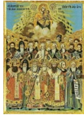
Σύναξη των Αγιορειτών Πατέρων