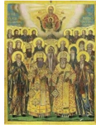
Σύναξη των Αγιορειτών Πατέρων