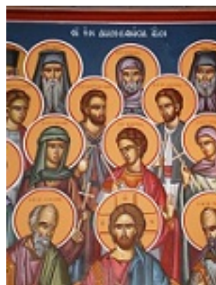
Σύναξις των εν Δωδεκανήσω Αγίων Σύναξις των εν Δωδεκανήσω Αγίων