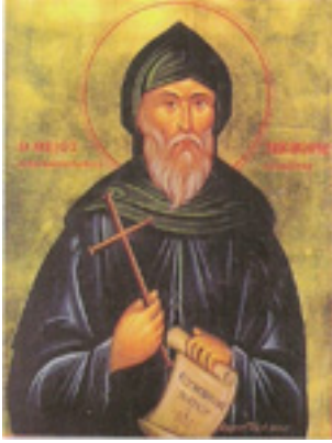
Όσιος Νίκανδρος ο Σιναΐτης ο εκ Καστελορίζου