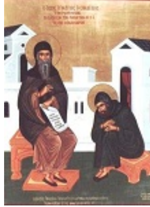
Ο Όσιος Ιγνάτιος ο Σιναΐτης διδάσκων τον μαθητή του Όσιο Νίκανδρο