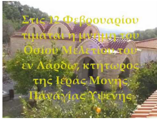
Ιερά Μονή Παναγίας Υψενής