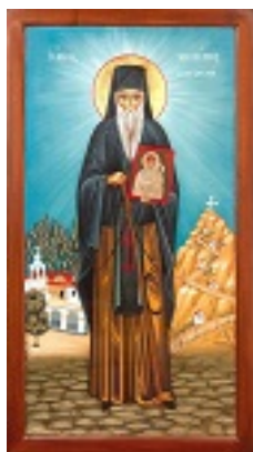
Όσιος Μελέτιος ο εν Υψενή