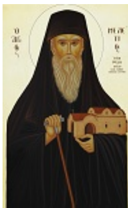
Όσιος Μελέτιος ο εν Υψενή