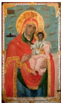
Η παλαιά εικόνα της Παναγίας της Βλασσαρούς