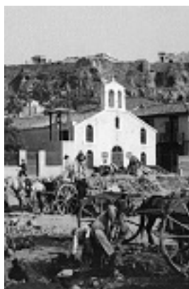
Το μικρό εκκλησάκι της Παναγίας της Βλασσαρούς