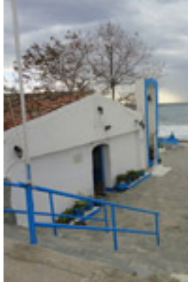
Παναγία Φανερωμένης στη Νέα Σκιώνη Χαλκιδικής