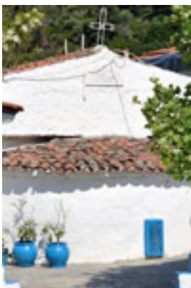
Παναγία Φανερωμένης στη Νέα Σκιώνη Χαλκιδικής