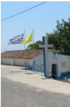
Παναγία Φανερωμένης στη Νέα Σκιώνη Χαλκιδικής