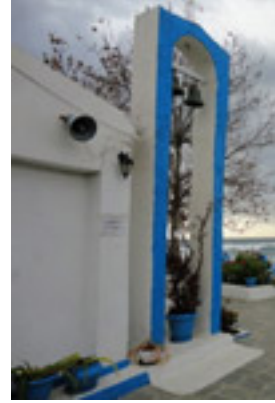
Παναγία Φανερωμένης στη Νέα Σκιώνη Χαλκιδικής