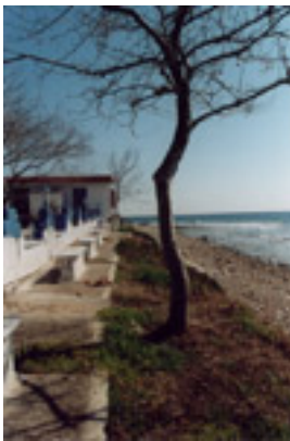
Παναγία Φανερωμένης στη Νέα Σκιώνη Χαλκιδικής