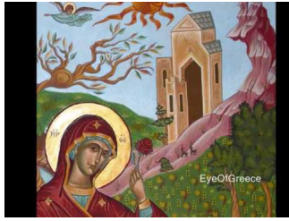
Ακούστε το «Άξιον Έστί»