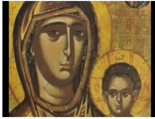
Ακούστε το «Άξιον Έστί»