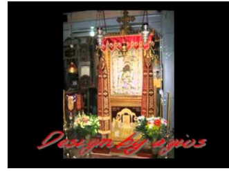
Διήγηση για τον ύμνο «Άξιον Έστί»