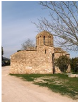
Σύναξη της Παναγίας της Μεσοσπορίτισσας στα Καλύβια (Εννέα Πύργοι)