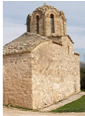
Σύναξη της Παναγίας της Μεσοσπορίτισσας στα Καλύβια (Εννέα Πύργοι)