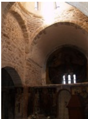
Σύναξη της Παναγίας της Μεσοσπορίτισσας στα Καλύβια (Εννέα Πύργοι)