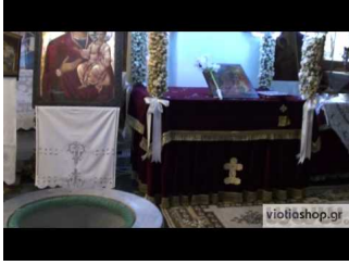
Η Παναγία η Σκριπού στον Ορχομενό