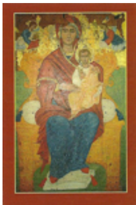
Παναγία η Παραβουινιώτισσα