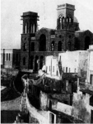
Η Παναγιά του Μπελώνια το 1898 μ.Χ.