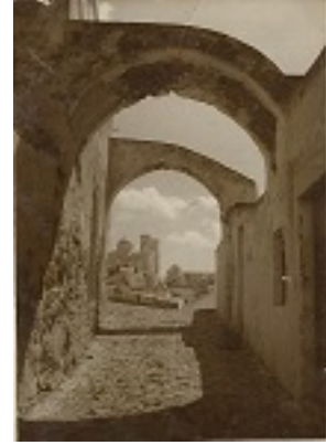
Παναγιά του Μπελώνια το 1936 μ.Χ.