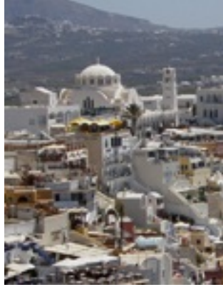
Παναγιά του Μπελώνια