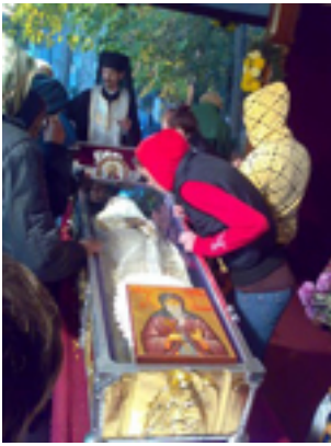
Όσιος Δημήτριος ο Νέος (Μπασαράμπης)