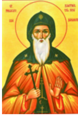
Όσιος Δημήτριος ο Νέος (Μπασαράμπης)