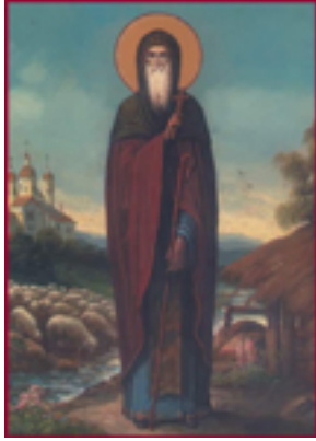
Όσιος Δημήτριος ο Νέος (Μπασαράμπης)