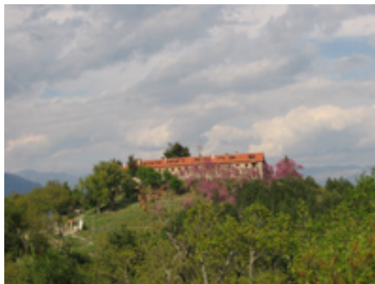
Άποψη της Ιεράς Μονής<br />Παναγίας Βαρνάκοβας