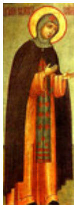
Οσία Ευφροσύνη του Πολώκ