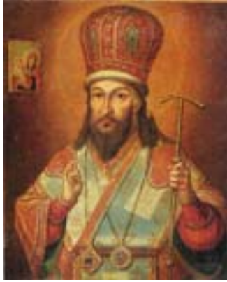
Άγιος Δημήτριος Μητροπολίτης Ροστόφ