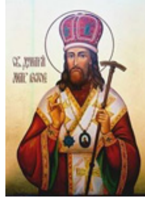
Άγιος Δημήτριος Μητροπολίτης Ροστόφ