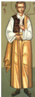
Άγιος Αργύριος ο Επανομίτης ο Νεομάρτυρας