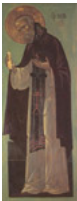
Όσιος Νείλος εκ Ρωσίας