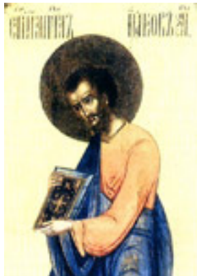
Άγιος Ιάκωβος ο Απόστολος