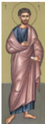
Άγιος Κάρπος ο Απόστολος<br />από τους Εβδομήκοντα