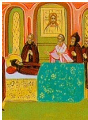
Όσιος Μακάριος ηγούμενος της μονής Κολγιαζίν της Ρωσίας