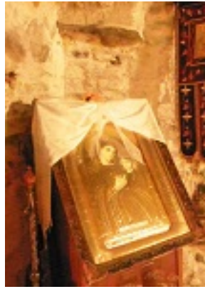
Σύναξη της Παναγίας της Χατηριάνισσας στον Οξύλιθο Ευβοίας