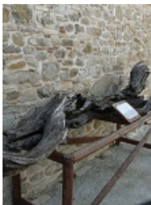
Σύναξη της Παναγίας της Χατηριάνισσας στον Οξύλιθο Ευβοίας