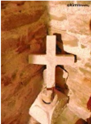
Σύναξη της Παναγίας της Χατηριάνισσας στον Οξύλιθο Ευβοίας