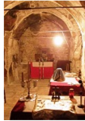
Σύναξη της Παναγίας της Χατηριάνισσας στον Οξύλιθο Ευβοίας