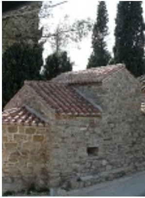
Σύναξη της Παναγίας της Χατηριάνισσας στον Οξύλιθο Ευβοίας