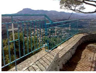
" Παναγία Οξυλιθιώτισσα " β΄ Οξύλιθος Ευβοίας