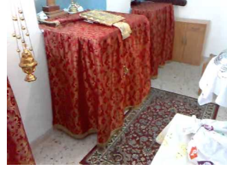
" Παναγία Οξυλιθιώτισσα " γ΄ Οξύλιθος Ευβοίας