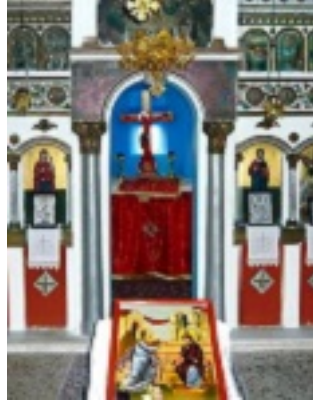
Σύναξη της Παναγίας της Οξυλιθιώτισσας στην Εύβοια