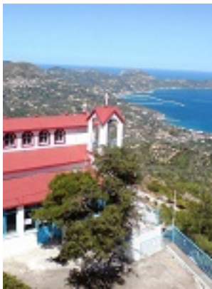
Σύναξη της Παναγίας της Οξυλιθιώτισσας στην Εύβοια