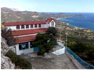
" Παναγία Οξυλιθιώτισσα " α΄ Οξύλιθος Ευβοίας