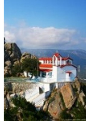
Σύναξη της Παναγίας της Οξυλιθιώτισσας στην Εύβοια