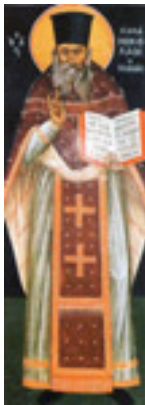
Άγιος Νικόλαος ο Πλανάς