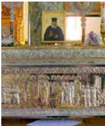
Η λειψανοθήκη του Αγίου Νικολάου Πλανά