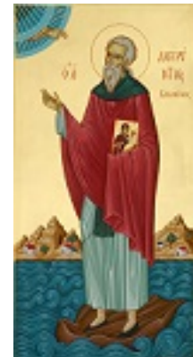
Όσιος Λαυρέντιος κτήτορας της Ιεράς Μονής Φανερωμένης στη Σαλαμίνα