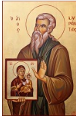
Όσιος Λαυρέντιος κτήτορας της Ιεράς Μονής Φανερωμένης στη Σαλαμίνα