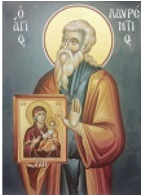
Όσιος Λαυρέντιος κτήτορας της Ιεράς Μονής Φανερωμένης στη Σαλαμίνα