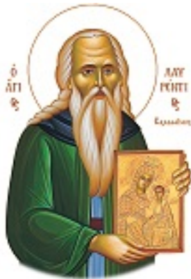
Όσιος Λαυρέντιος κτήτορας της Ιεράς Μονής Φανερωμένης στη Σαλαμίνα