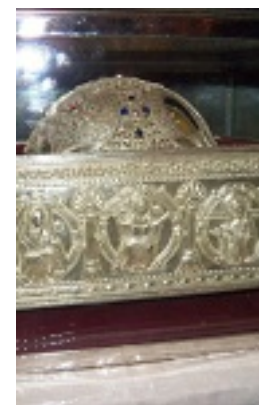
Η Αγία κάρα του Οσίου Λαυρεντίου του εν Σαλαμίνα