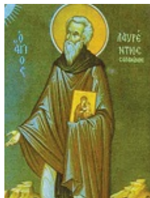
Όσιος Λαυρέντιος κτήτορας της Ιεράς Μονής Φανερωμένης στη Σαλαμίνα