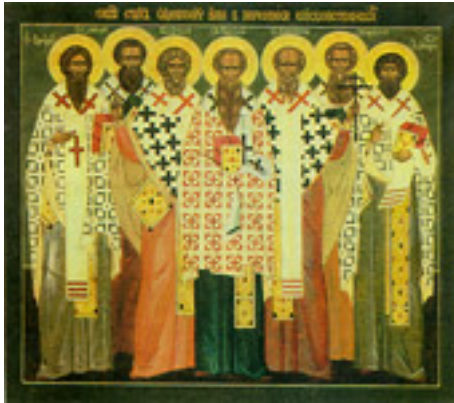
Οι Άγιοι Εφραίμ, Βασιλεύς, Ευγένιος, Αγαθόδωρος, Ελπίδιος, Καπίτων και Αιθέριος