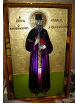
Άγιος Εφραίμ ο Μεγαλομάρτυρας και θαυματουργός