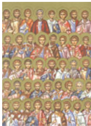
Άγιοι Τεσσαράκοντα δύο<br />Μάρτυρες από το Αμόριο