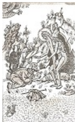
Όσιος Μάρκος ο Αθηναίος