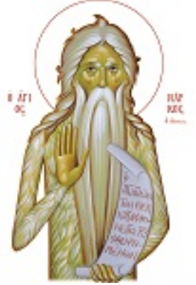
Όσιος Μάρκος ο Αθηναίος