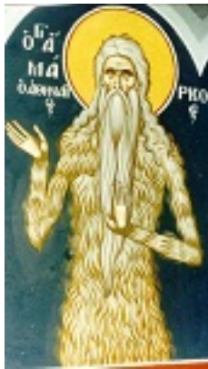
Όσιος Μάρκος ο Αθηναίος