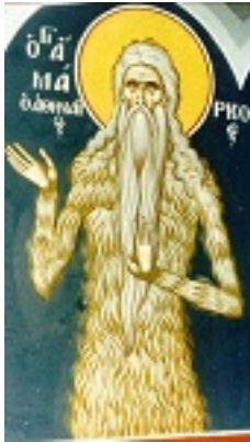
Όσιος Μάρκος ο Αθηναίος