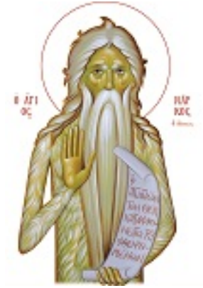
Όσιος Μάρκος ο Αθηναίος