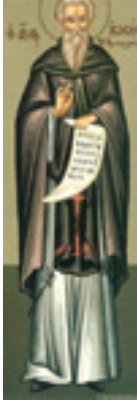
Όσιος Ιωσήφ ο Υμνογράφος