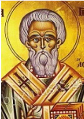
Άγιος Γρηγόριος Επίσκοπος Άσσου