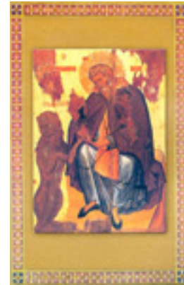
Όσιος Γεράσιμος<br />ο Ιορδανίτης Όσιος Γεράσιμος<br />ο Ιορδανίτης Όσιος Γεράσιμος<br />ο Ιορδανίτης