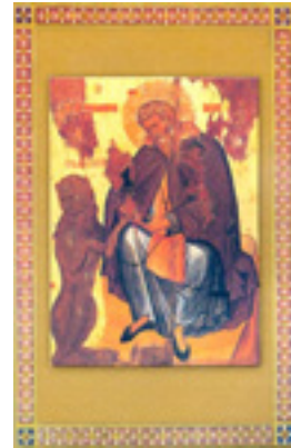
Όσιος Γεράσιμος<br />ο Ιορδανίτης Όσιος Γεράσιμος<br />ο Ιορδανίτης Όσιος Γεράσιμος<br />ο Ιορδανίτης