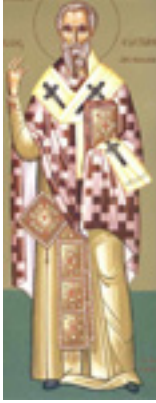
Άγιος Ευστάθιος<br/>Αρχιεπίσκοπος Αντιοχείας<br/>της Μεγάλης