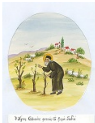
Άγιος Σοφιανός επίσκοπος

Δρυϊνουπόλεως καί Αργυροκάστρου Δρυϊνουπόλεως καί Αργυροκάστρου