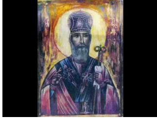
ΟΣΙΟΣ ΣΟΦΙΑΝΟΣ Επίσκοπος Δρινουπόλεως & Αργυροκάστρου