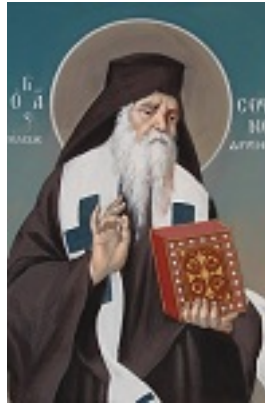
Άγιος Σοφιανός επίσκοπος