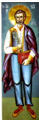
Άγιος Ιωάννης Κουλακιώτης ο εν Θεσσαλονίκη